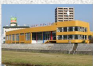
【諫早パークレーン】