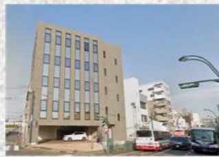
【西州建設本社(有明ビル)】