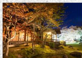
【原鶴温泉観光ホテル小野屋】