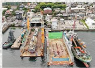
【シンナガ(修繕ドック)】